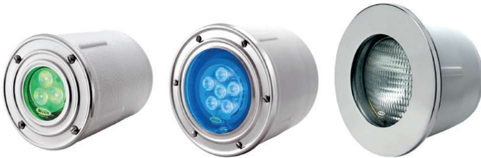
De izquierda a derecha: Lago 50, Lago 100 y Lago 300