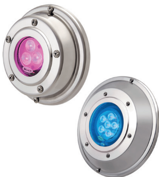
Laguna 50 (arriba) y Laguna 100 (abajo)

Beltram Iluminación www.beltram-iluminacion.com.ar