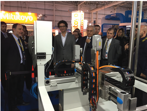
Los sistemas de paletizado utilizados para almacenamiento alcanzan movimiento de masas de hasta 50 kilos