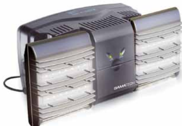
Línea GX2F Plus