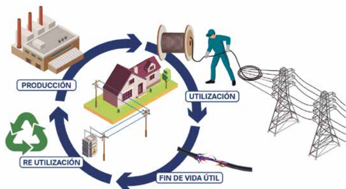
Recupero de componentes de conductores eléctricos

Asimismo, evita a toda costa la quema del recubrimiento, porque quemar los envoltorios, la vaina, etc. genera emisiones que contaminan la atmósfera, y evita también arrojar el material que se pela (PVC, polietileno) en los cursos de agua, porque de otra manera se contaminarían los cursos de agua con químicos que se desprenden de estos componentes. ■