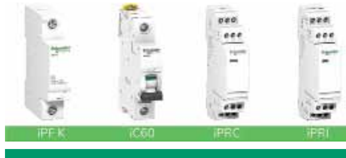
iPF K, iC60, iPRC, iPRI

Los dispositivos conectados al circuito eléctrico durante una sobretensión transitoria también pueden verse dañados. Las sobretensiones provocan