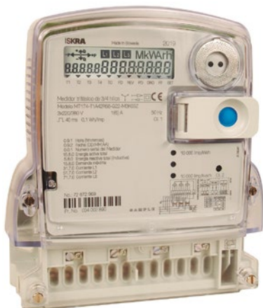
Medidor polifásico multi-tarifa MT174

“La experiencia muestra la conveniencia de realizar una convalidación del tipo en forma periódica para verificar, como se ha comprobado en varias oportunidades, que no existan cambios no informados que alteren el comportamiento del producto original, asegurando así el cumplimiento de todos los requisitos establecidos en la norma”.