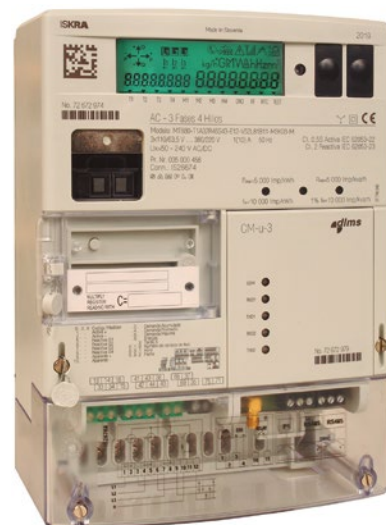
Medidor de precisión multifuncional MT880

“La convalidación del tipo establecida según G.3 es el proceso que permite a los compradores o usuarios del producto asegurar que los fabricantes no hayan realizado cambios del producto original, omitiendo realizar el referido proceso para verificar la validez de los ensayos de tipo.