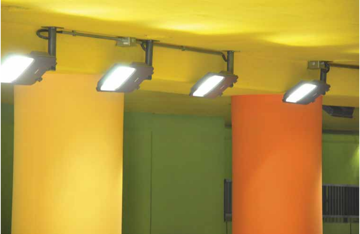
Luminaria marca Strand modelo RS160 LED