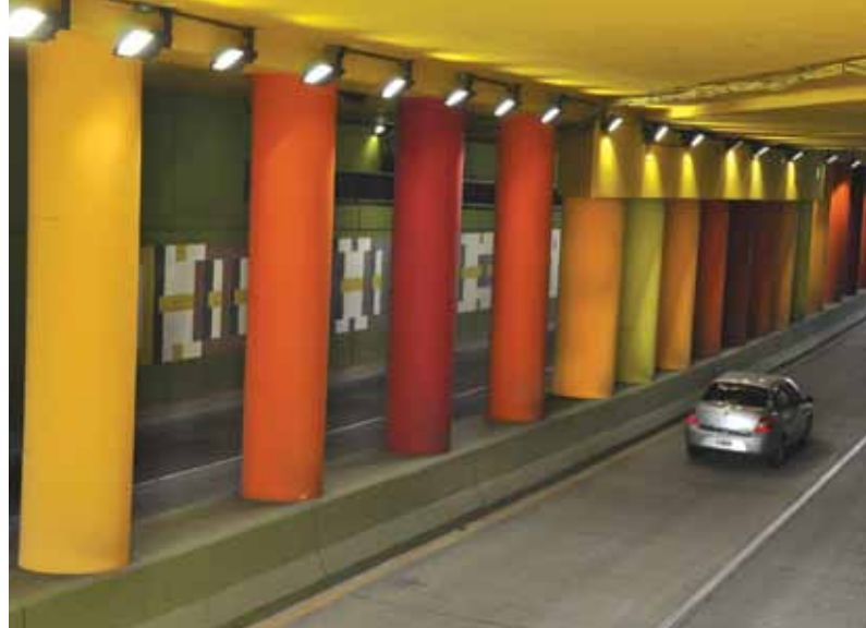
Paso bajo nivel avenida San Martín - CABA