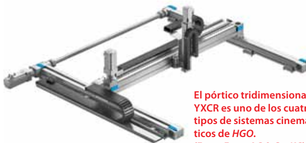
El pórtico tridimensional YXCR es uno de los cuatro tipos de sistemas cinemáticos de HGO .

Más información: www.festo.com.ar/handling