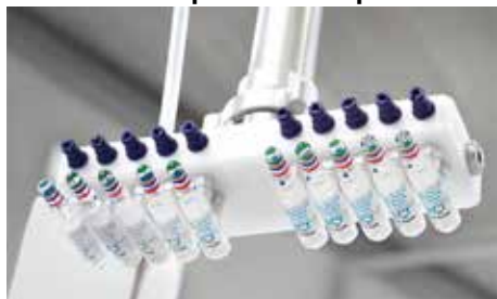
Productos para pick and place de ampollas